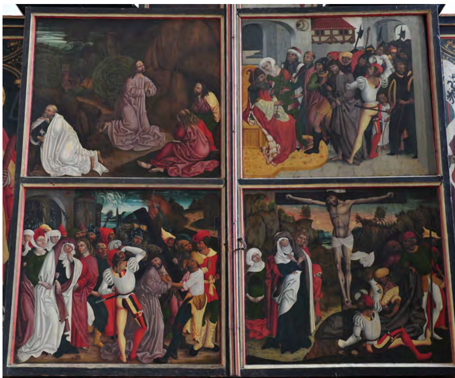
St. Vinzenz, Altar geschlossen